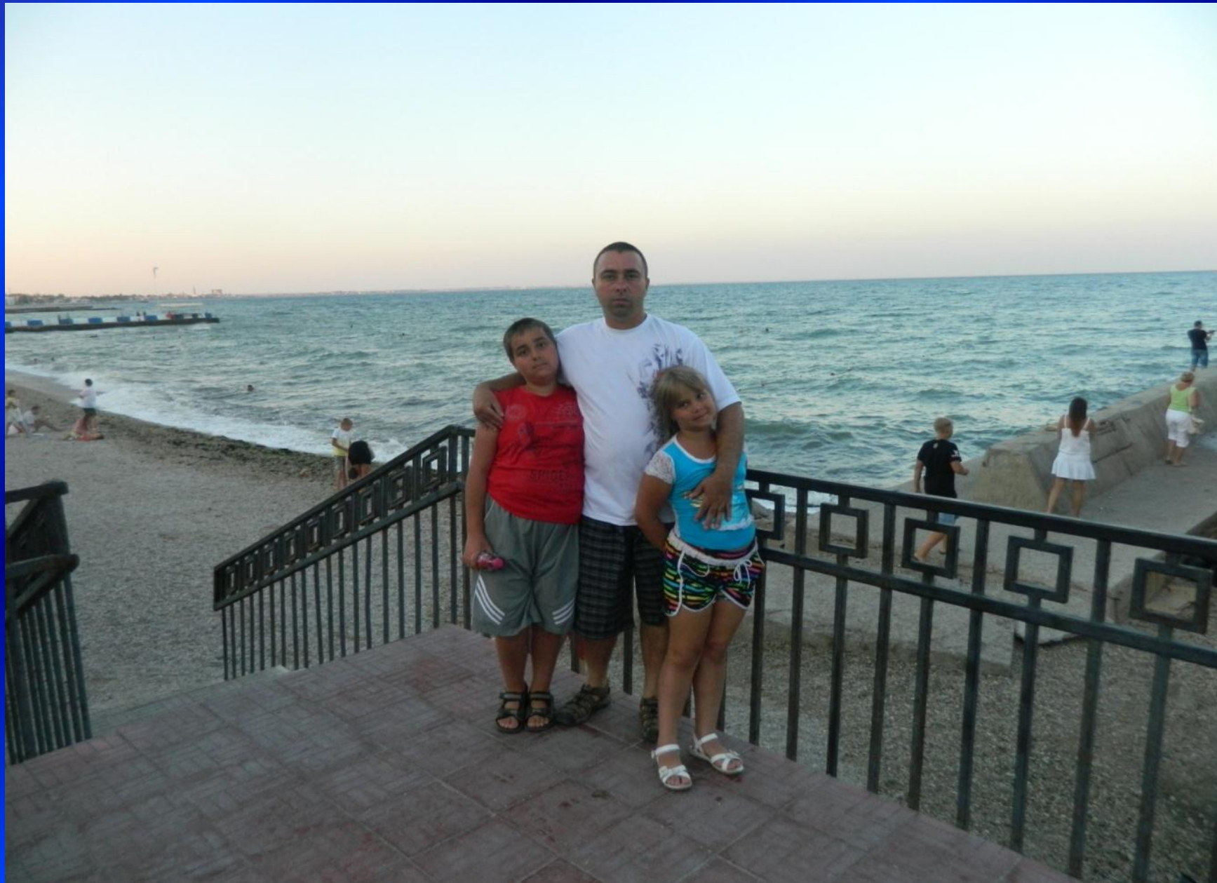
Клужина из отцов