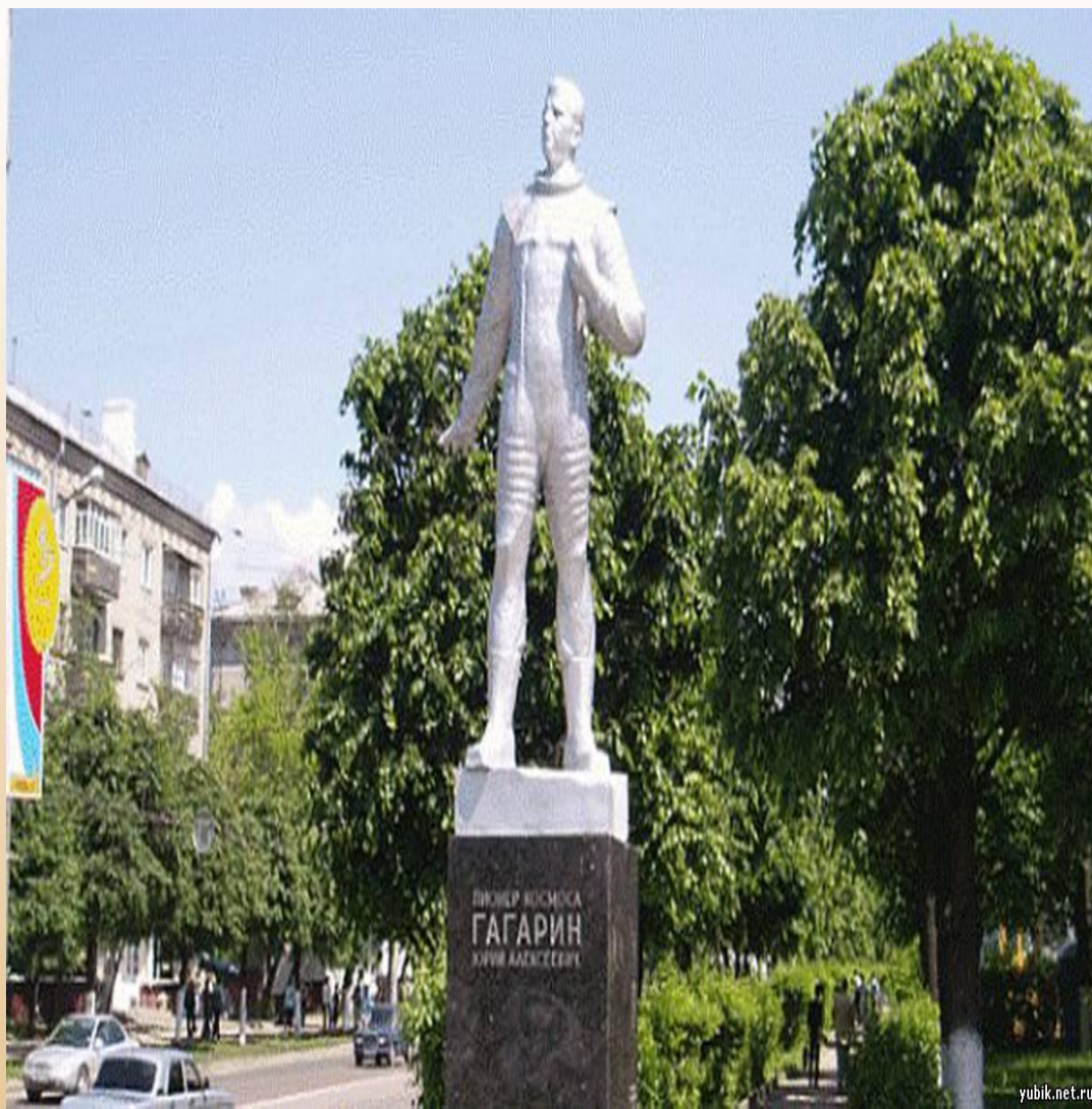
Первый космонавт Земли Юрий Алексеевич Гагарин