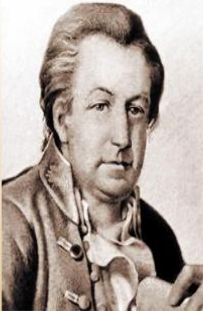
Петр Егорович Егоров архитектор 18 века, один из авторов ограды Летнего сада Санкт-Петербурга.