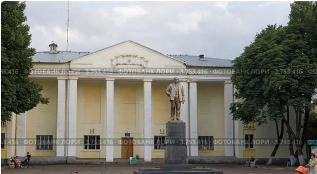
Памятник В. И. Ленину около ДК в городе Киреевске

Киреевский районный краеведческий музей (основан в 1986 г.)