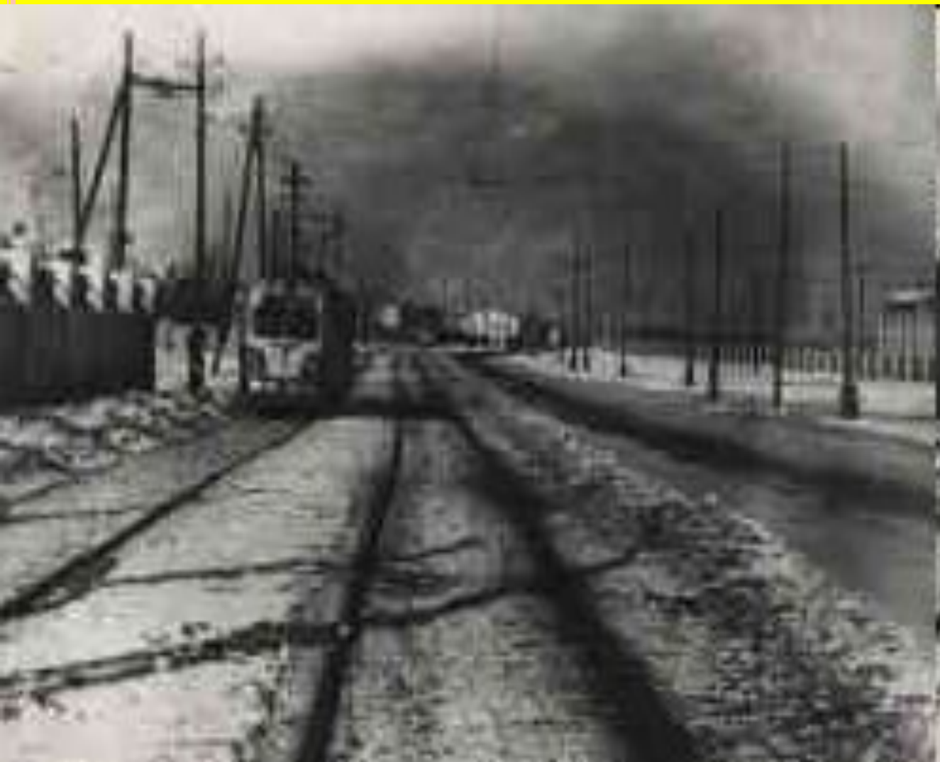
Улица Ангарская Слева завод «Ахтуба», справа трамвайный парк № 2. 1953 г.