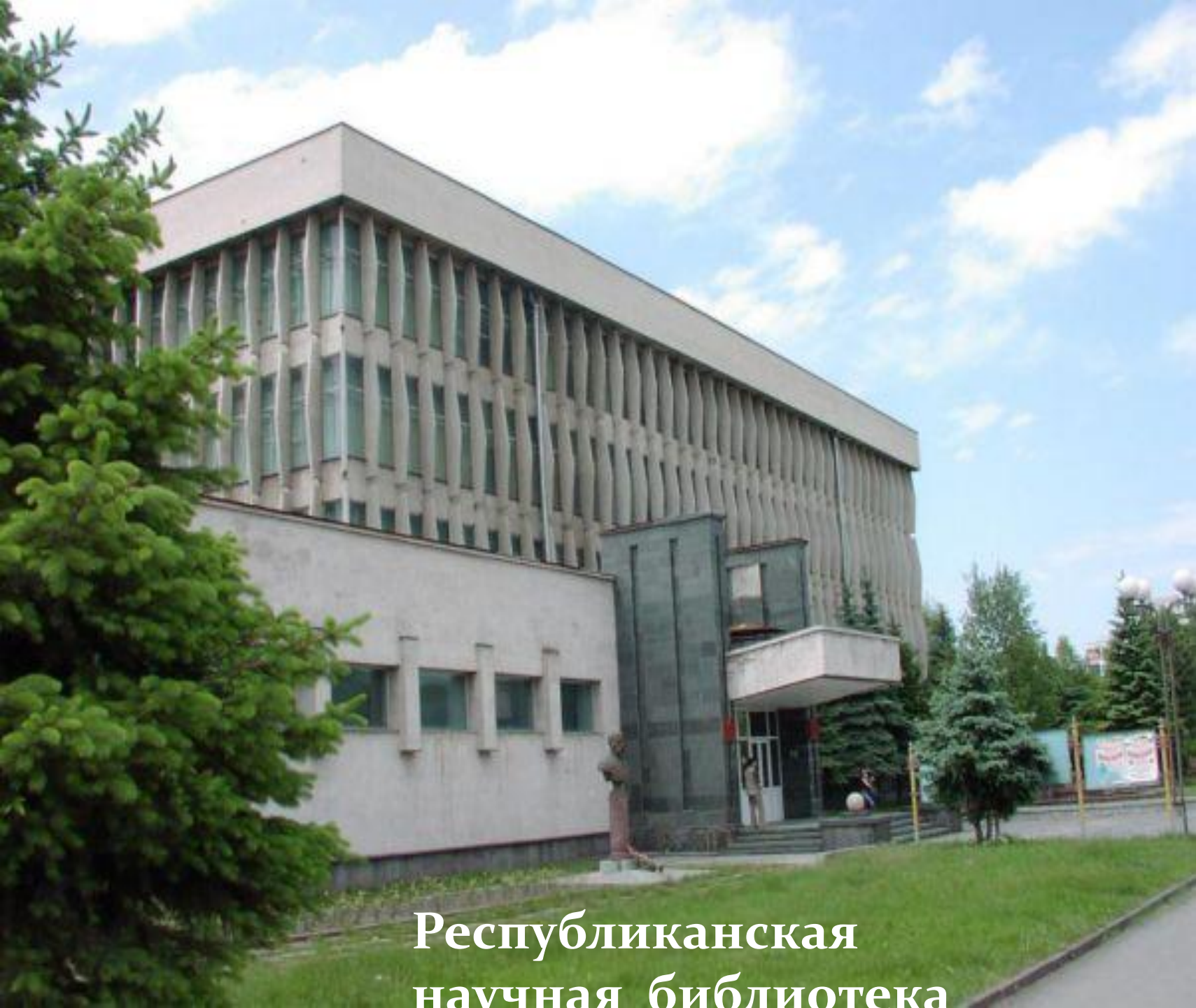
Республиканская научная библиотека