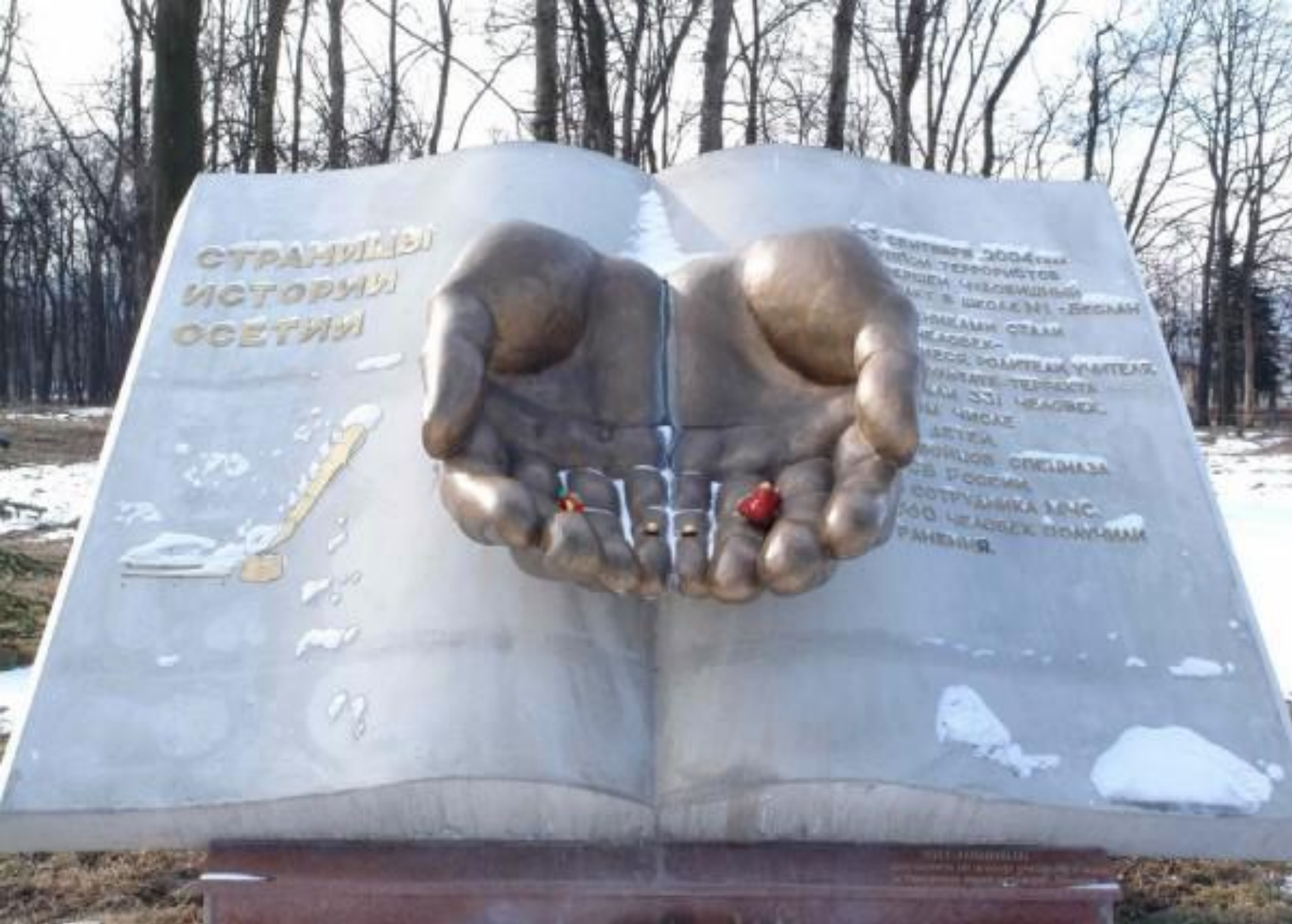
Памятник жертвам бесланской трагедии на Мемориале Славы