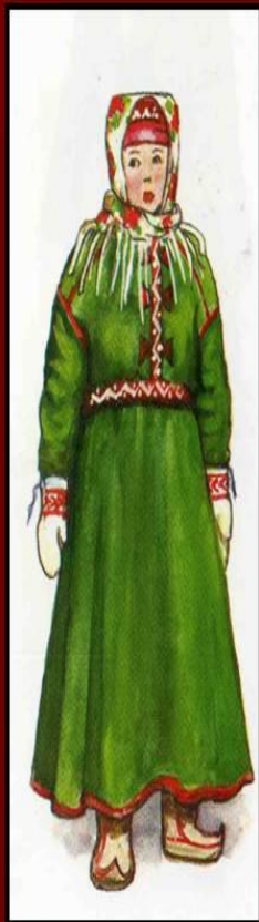
КАНЬГИ - обувь