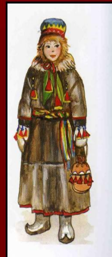
ЯРЫ - обувь