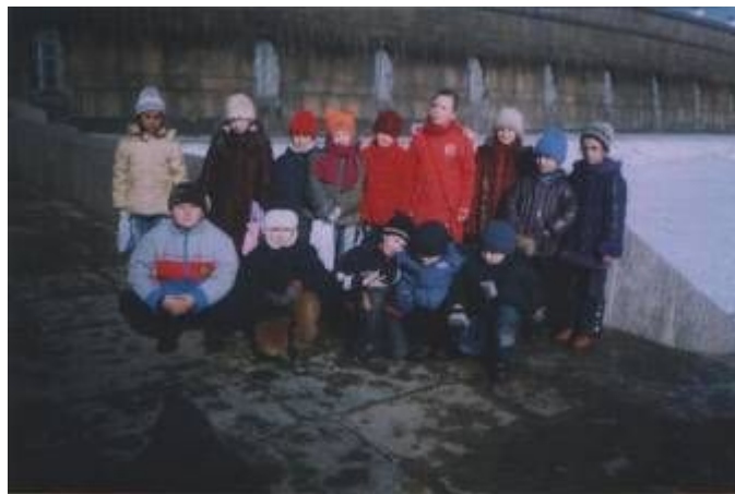
В музее времени