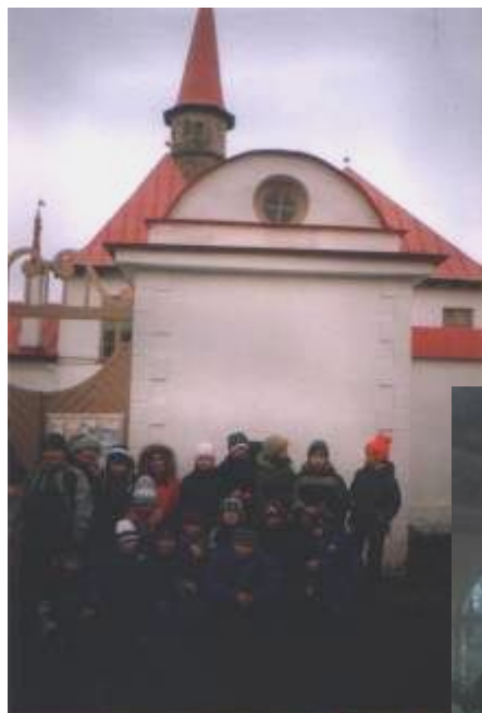
Приоратский замок г. Гатчина