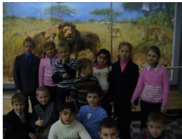
В зоологическом музее