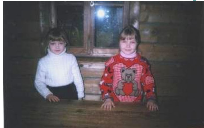
В крестьянской школе