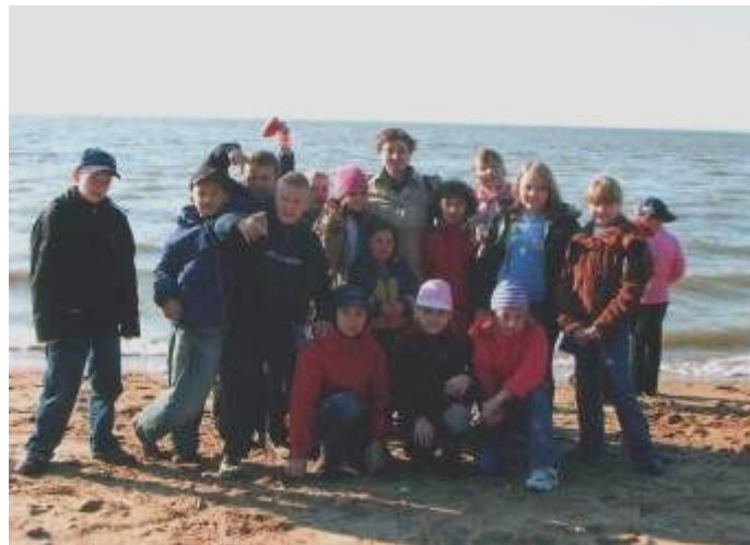
На берегу Холодного моря