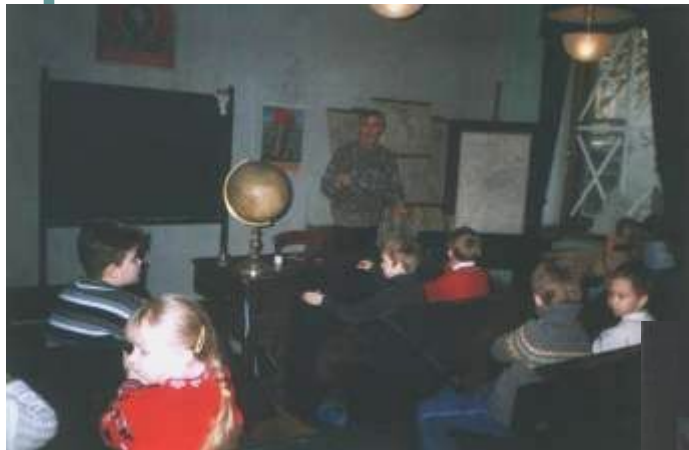
В старинной гимназии