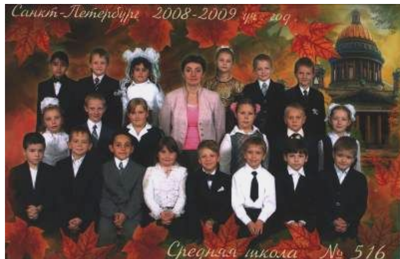
2008-2009 учебный год – 1 «б» класс