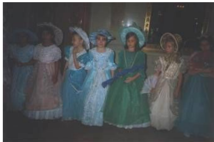
Бал в Елагиноостровском дворце