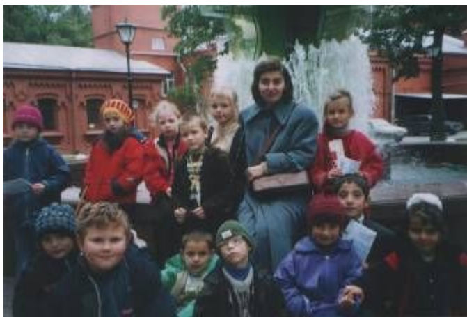
В музее воды