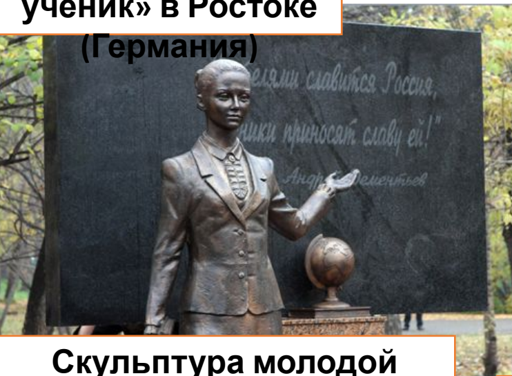
Скульптура молодой учительницы, ведущей урок. Красноярск