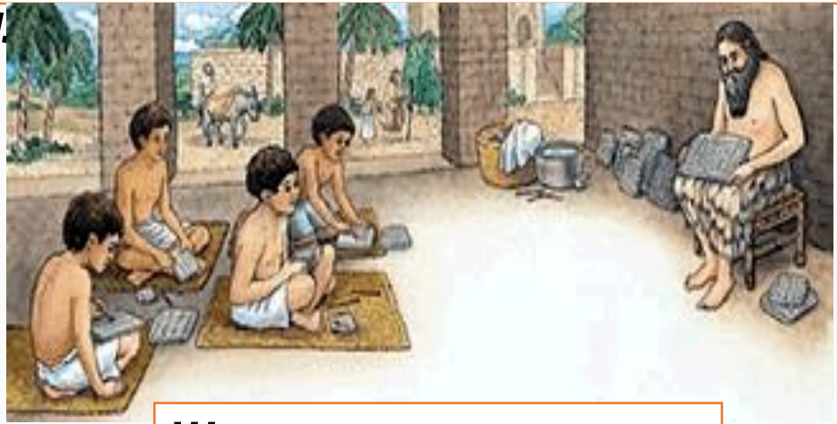
Школа древнего Шумера