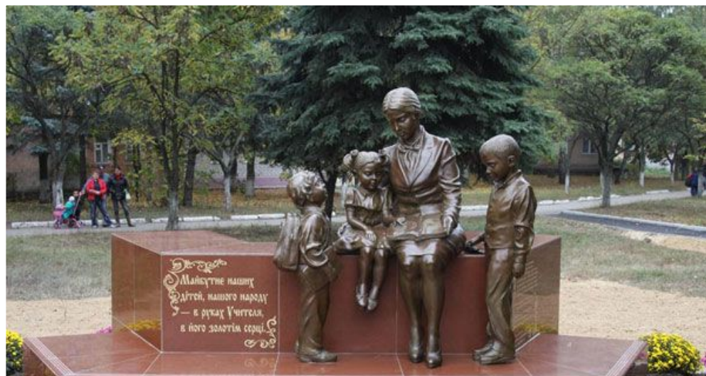
Памятник Учительнице. Дергачи, Харьковская обл., Украина