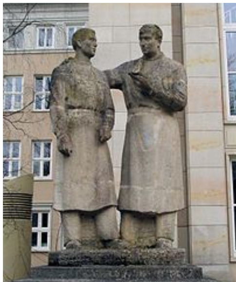
Монумент «Учитель и ученик» в Ростоке (Германия)