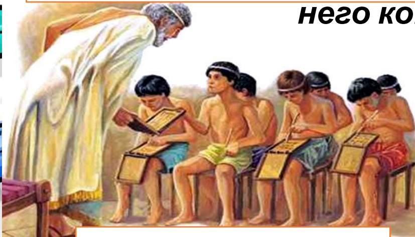
Школа в древней Греции

Говоря о том, откуда берет свое начало профессия учителя, я могу уверенно сказать, что учителя появились с возникновением человечества. Ведь старшие всегда передают младшим свой опыт, знания и умения. Так, животные-родители учат своих детенышей. Но человек – существо общественное, и ему важно не только научиться выполнять биологическое предназначение, но и постичь все те знания, что до него копи.