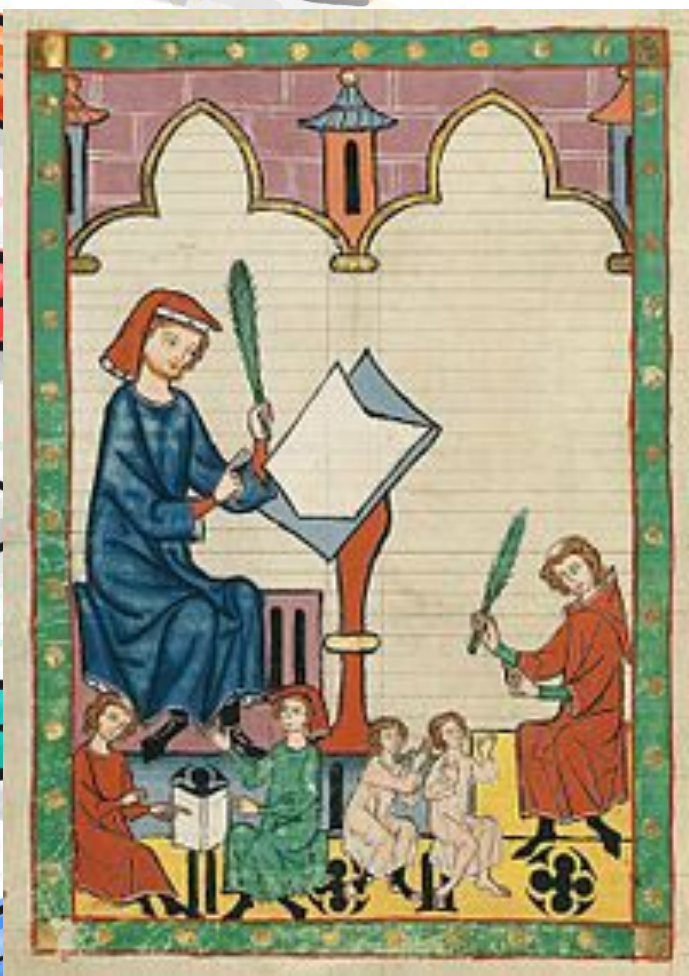
Учитель и ученики (средневековая миниатюра)

Часто благодаря своей первой учительнице человек делает профессиональный выбор, ведь именно на уроках в начальной школе он знакомится с окружающим миром и начинает ориентироваться в различных