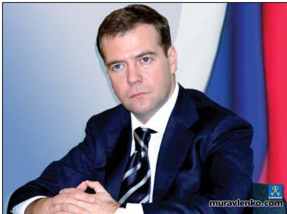
Дмитрий Анатольевич Медведев