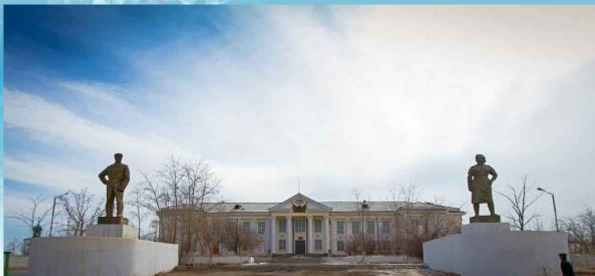
Дом культуры «Шахтер»