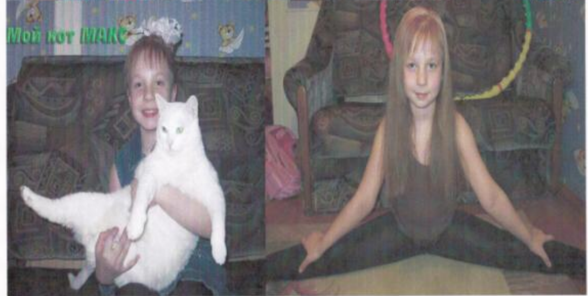
Мой кот ИАКЕ