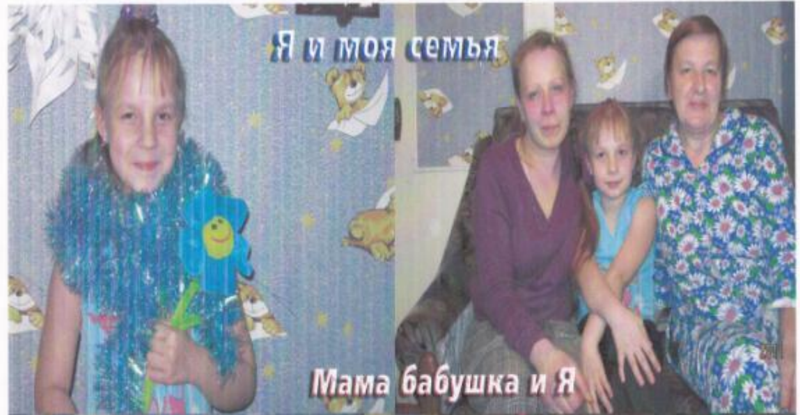
Я и моя семья