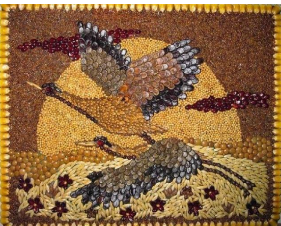
Мозаика из злаковых культур