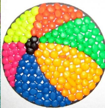
Орнамент мозаики из шариков пластилина