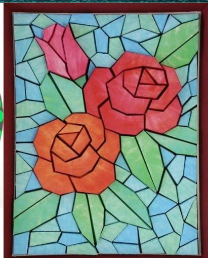
Аппликационная мозаика из цветной бумаги