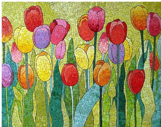
Кракле-мозаика из яичной скорлупы