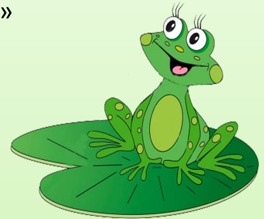
Это лягушонок Яша