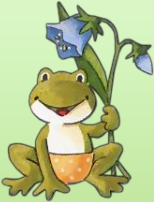
Это Ма ш а

Ма ш е Па ш а дал матр ёш ку. Это Ма ш ина март ёш ка.