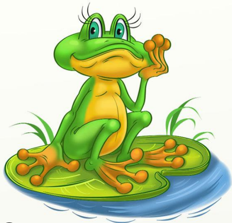
Это лягушонок Алёша

Это друзья лягушонок Паша и лягушонок Яша, имена лягушата появляются по щёлчку языка, чётко проговаривай звук «Ш»