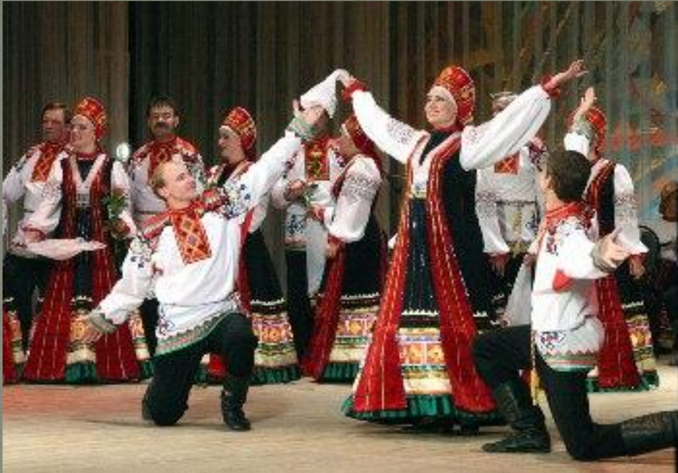
Государственный академический Воронежский русский народный хор им.К.И.Массалитинова.