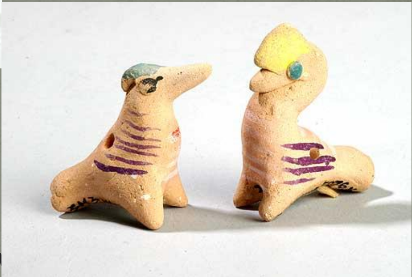
Воронежская керамика игрушка .