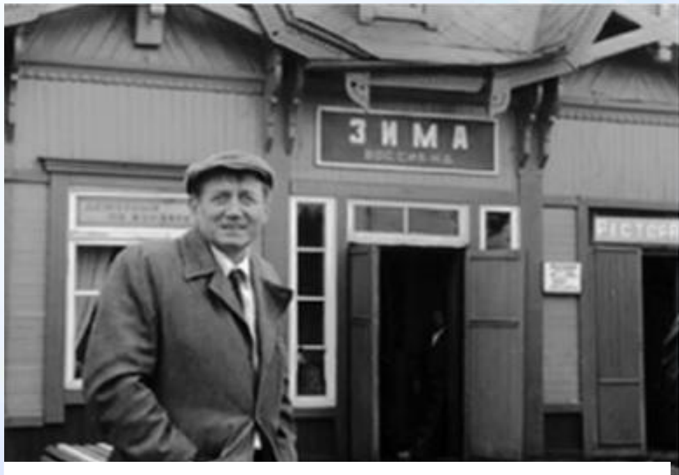
Евгений Евтушенко - поэт