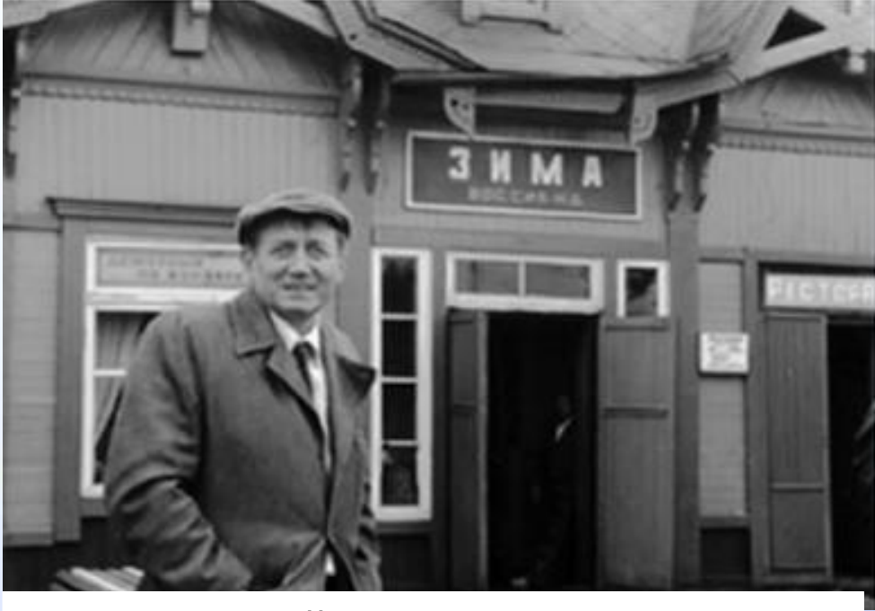
Евгений Евтушенко - поэт