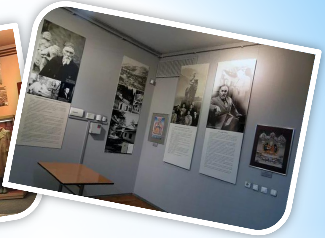
- Посмотреть историю Тувы