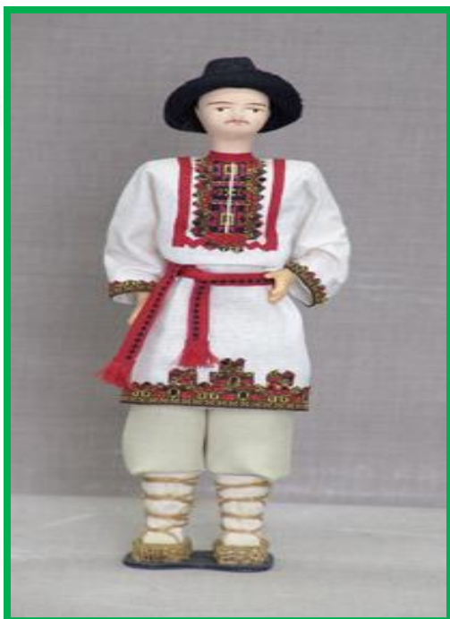
Мордовский мужской национальный костюм