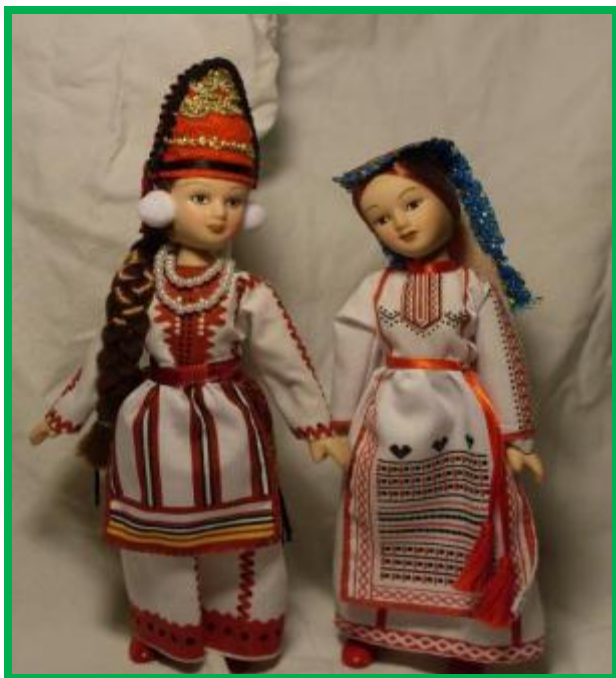
Мордовский женский национальный костюм