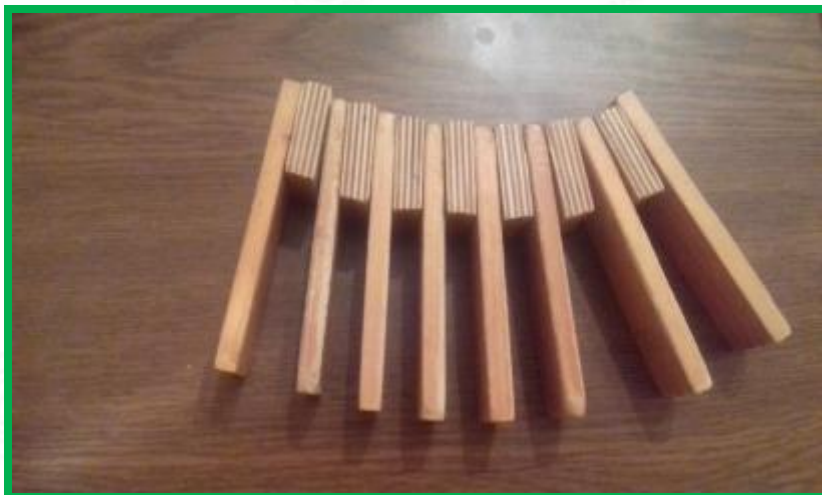
■ Трещётка – сатаркка