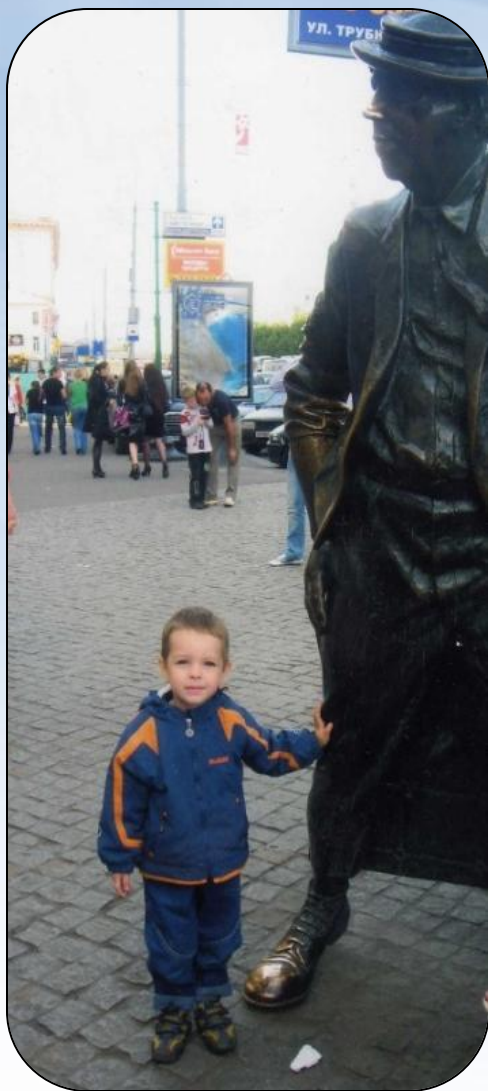
Цирк на Цветном бульваре