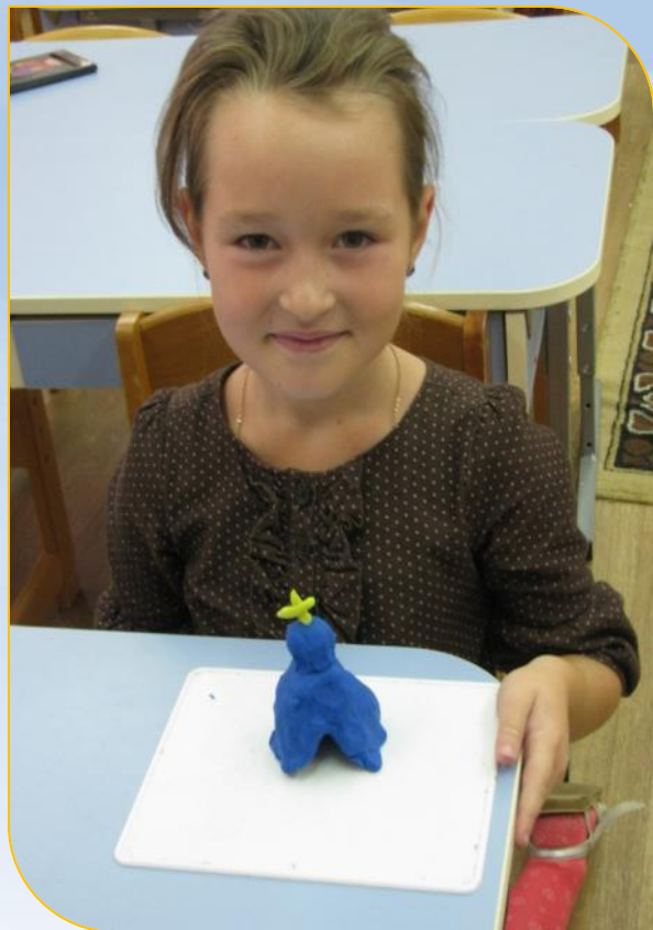
Архитектурные памятники Кремля – Царь- колокол