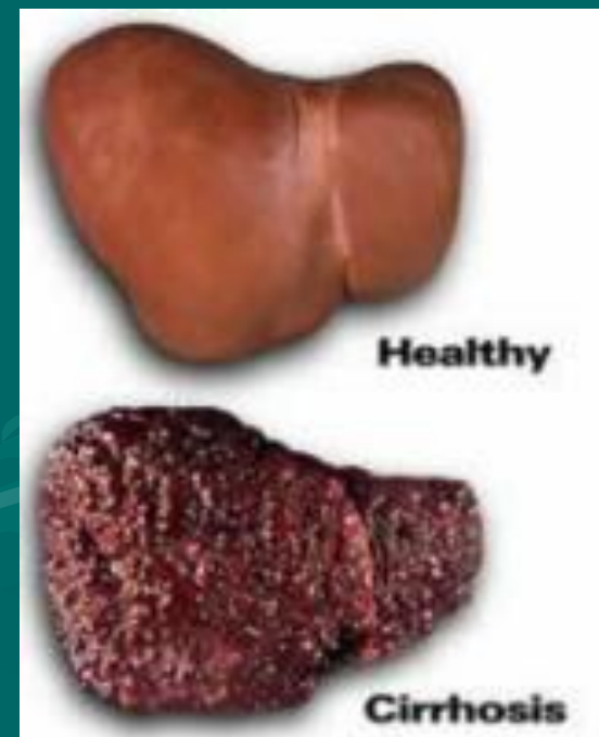
Печень здорового и пьющего человека