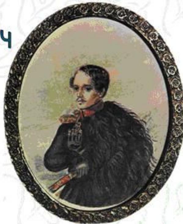
Автопортрет. 1837 - 1838