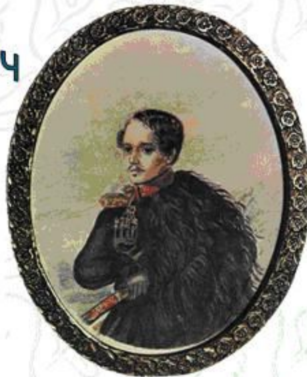
Автопортрет. 1837 - 1838