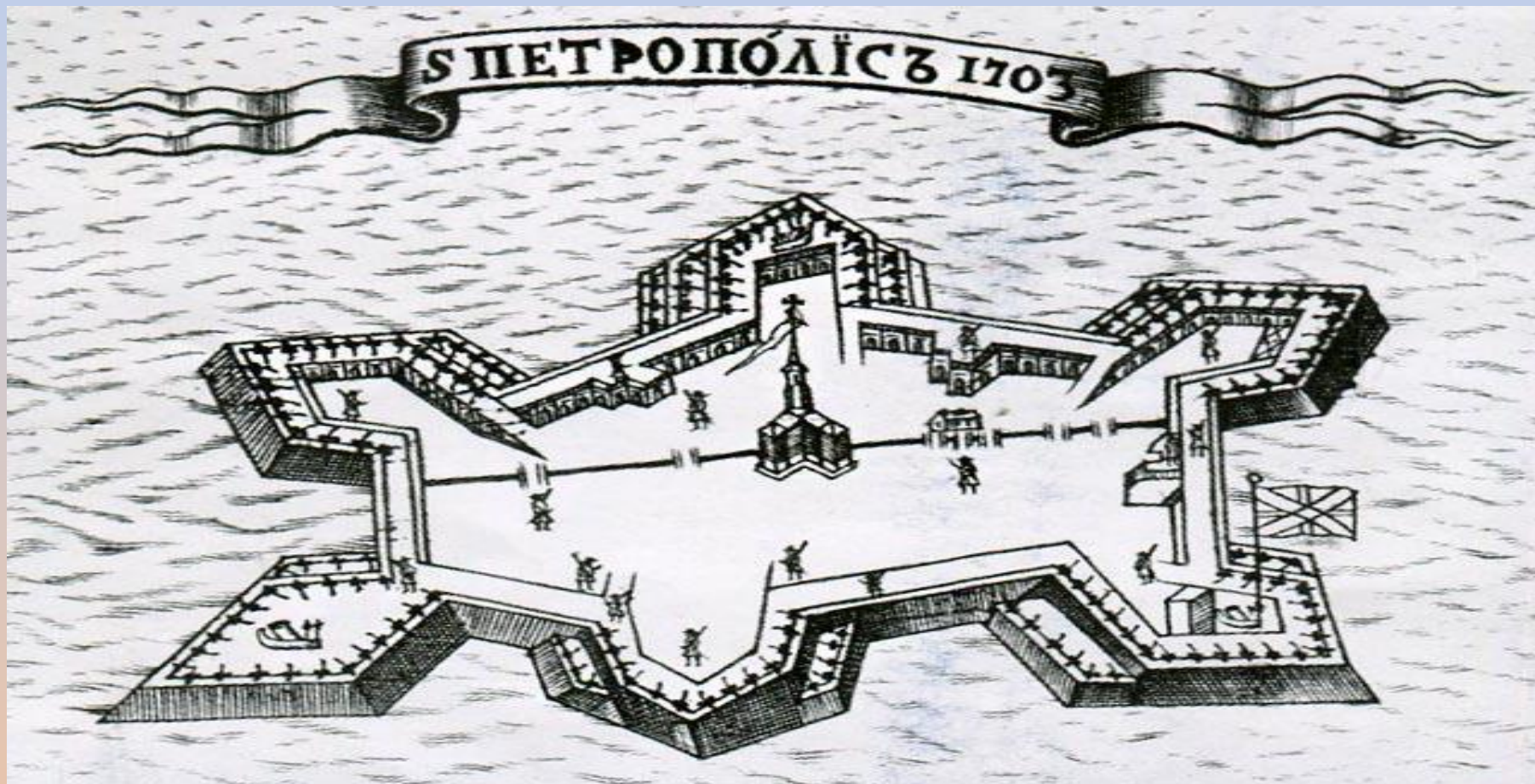
Бастионы Петропавловской крепости Меншиков, Головкин, Зотов, Трубецкой, Нарышкин, Государев