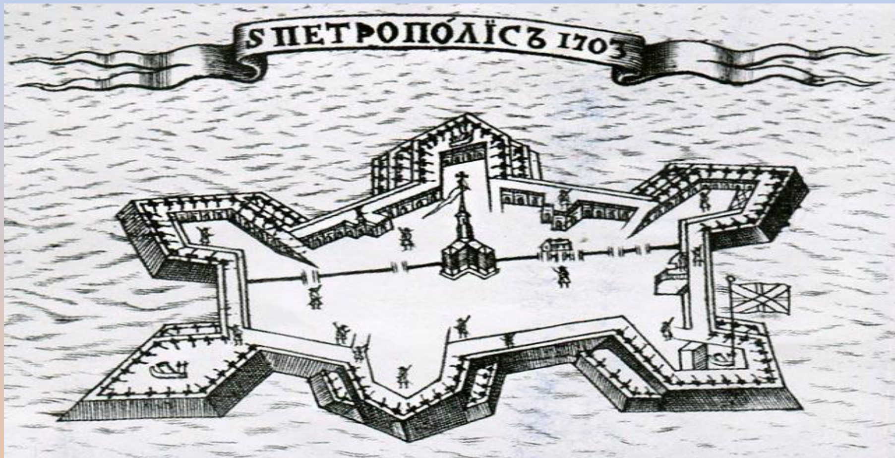
Бастионы Петропавловской крепости Меншиков, Головкин, Зотов, Трубецкой, Нарышкин, Государев