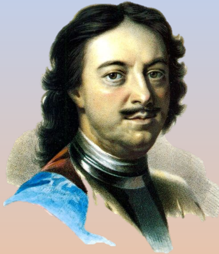
Петр Великий – первый российский император 1672 – 1725гг.