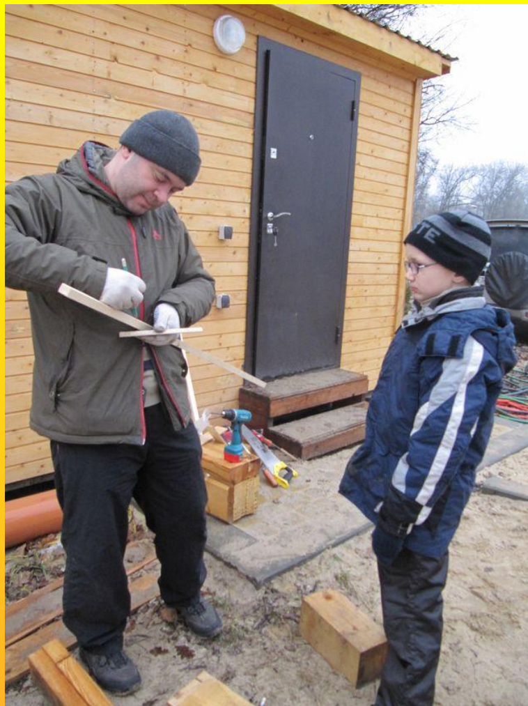
Папа делает вид, что разбирается в изготовлении кормушек