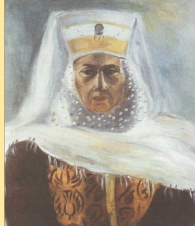
Улжан Кунанбаева, мать Абая