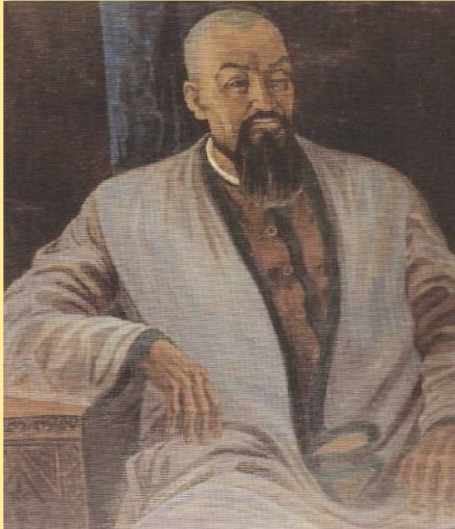
Кунанбай Ускенбаев, отец Абая старший султан