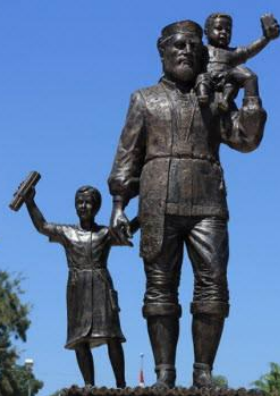
Нозль Баба Мудлаш