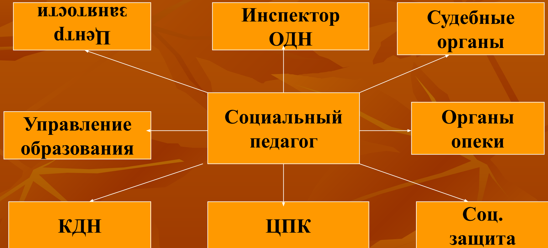
СХЕМА ВЗАИМОДЕЙСТВИЯ СОЦИАЛЬНОГО ПЕДАГОГА