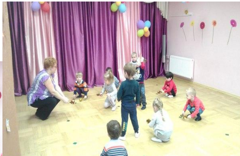
Танец с ложками