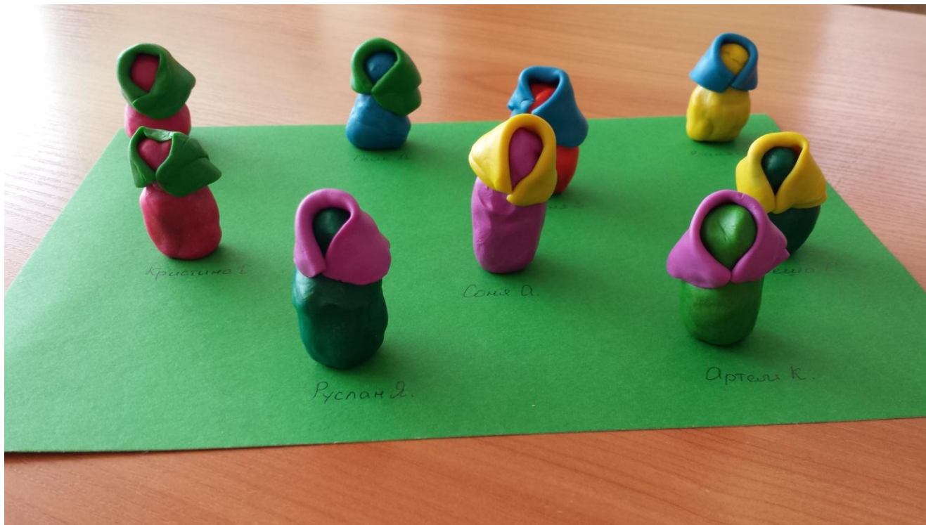
Лепка «Матрешка в платочке»