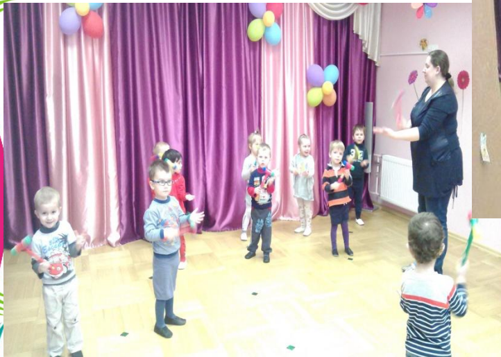
Танец с молоточками