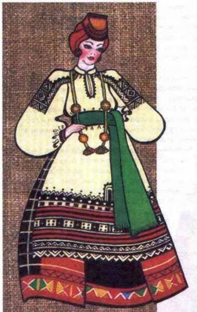
ЮЖНОРУССКИЙ ЖЕНСКИЙ КОСТЮМ (ПОНЕВА)

А в южных районах России модницы одевали поневный комплекс. Понева – юбка. Она одевалась непременно поверх рубахи, затем шел передник, а затем наверху вышивкой