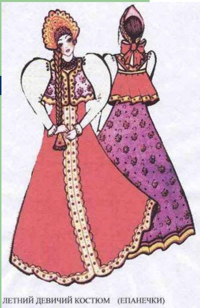
ЛЕТНИЙ ДЕВИЧИЙ КОСТЮМ (ЕПАНЕЧКИ)

В праздничный наряд входили и так называемые душегрей – епанечки или коротены – коротенькие кофточки на лямочках, похожие на сарафанчики