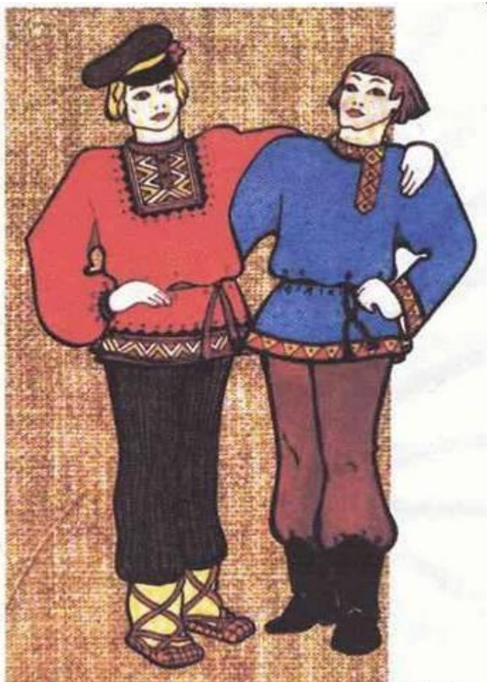
МУЖСКОЙ КРЕСТЬЯНСКИЙ КОСТЮМ (РУБАХА И ПОРТЫ)

Основой мужского костюма была рубаха. Она доходила до колен и подвязывалась поясом. Шили её из белой, синей, красной ткани. Частью костюма были штаны (порты). Они заправлялись в сапоги или обёртывались онучами.