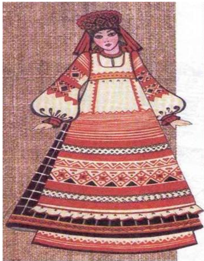
ПРАЗДНИЧНЫЙ ДЕВИЧИЙ КОСТЮМ. (ПЕРЕДНИК)