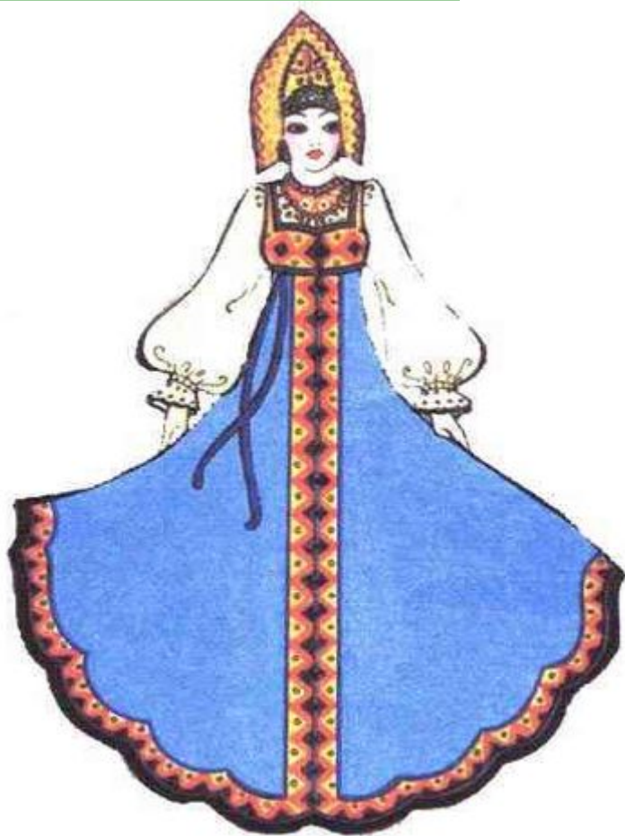
СЕВЕРОРУССКИЙ ЖЕНСКИЙ КОСТЮМ (САРАФАН)