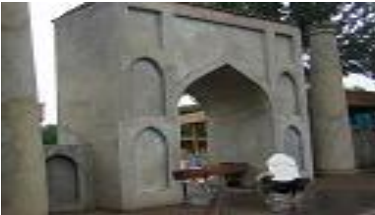
Монументальные ворота и вкусный плов