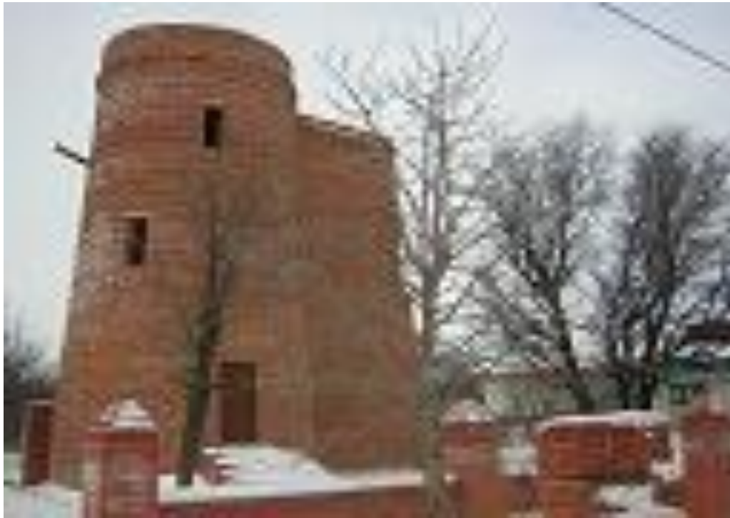
Уменьшенная копия Девичьей башни в Баку