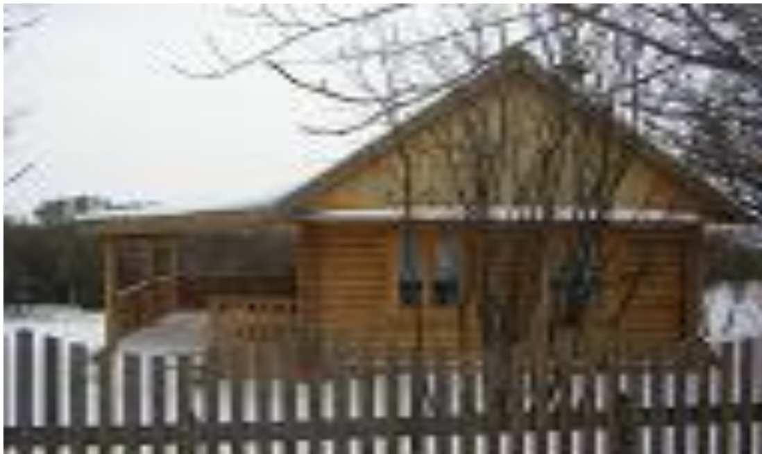
Небольшой дом + баня