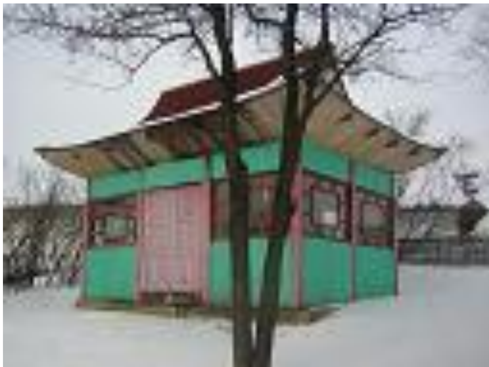
Корейская подога и ворота в национальном стиле