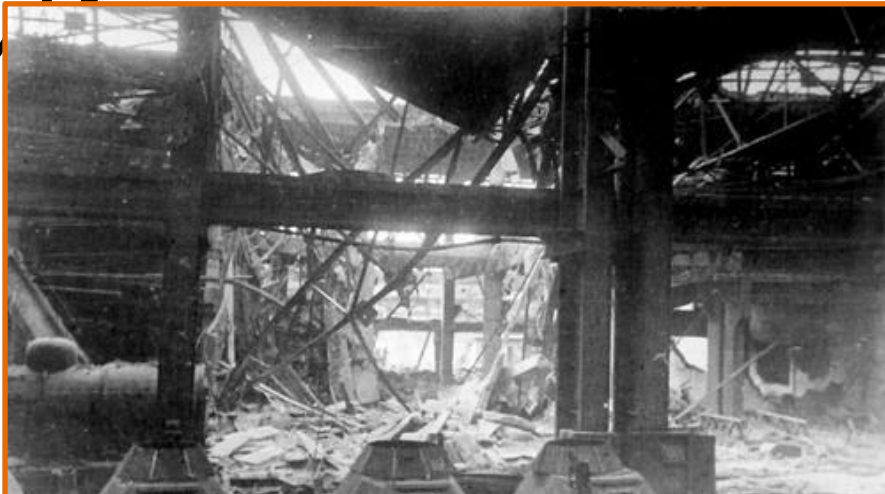
ГАЗ после налета фашистской