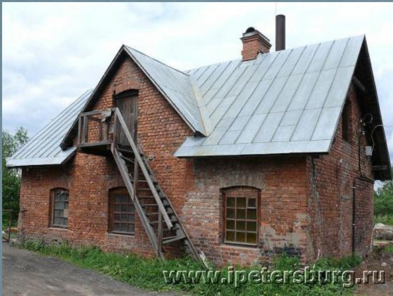
Гоподская кухня и прачечная