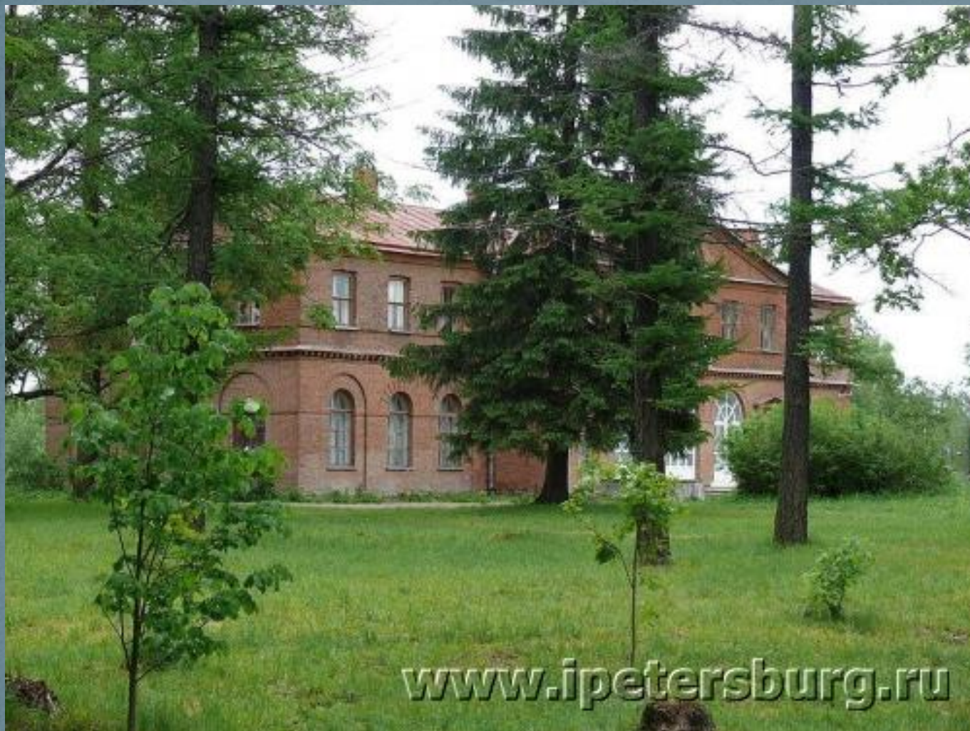
Руины флигеля усадьбы