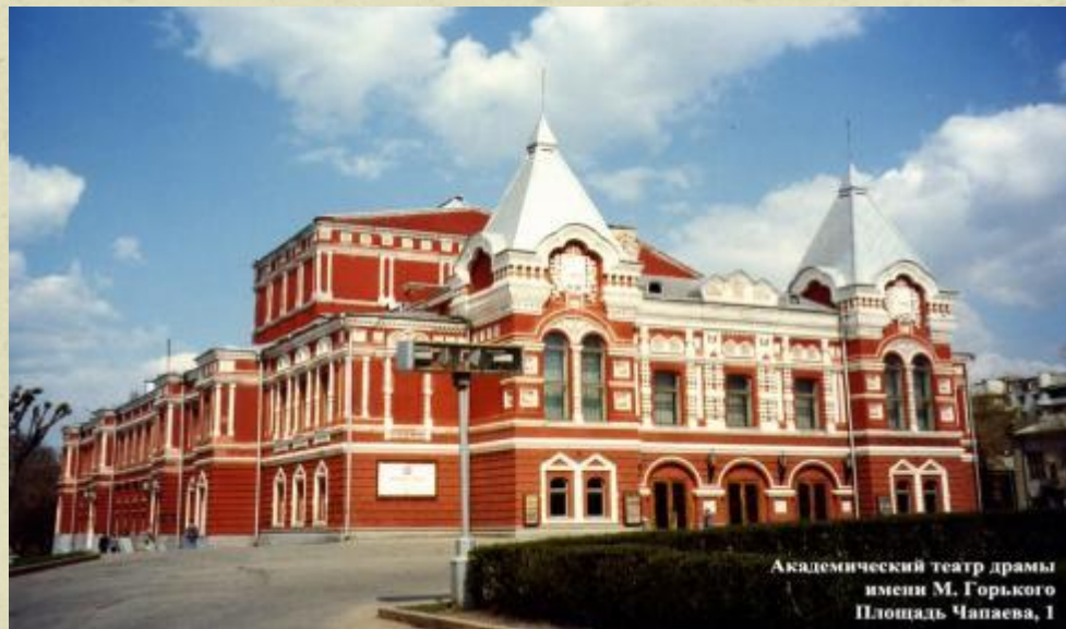
Академический театр драмы имени М. Горького Площадь Чапаева, 1