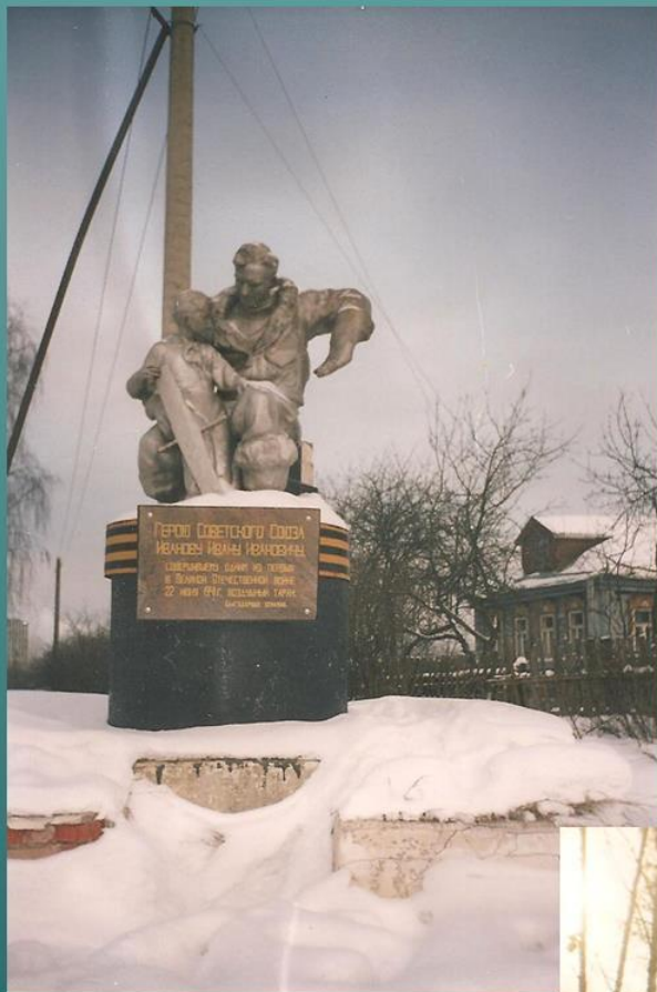
ПАМЯТНИК И.И. ИВАНОВУ ВО ФРЯЗИНО