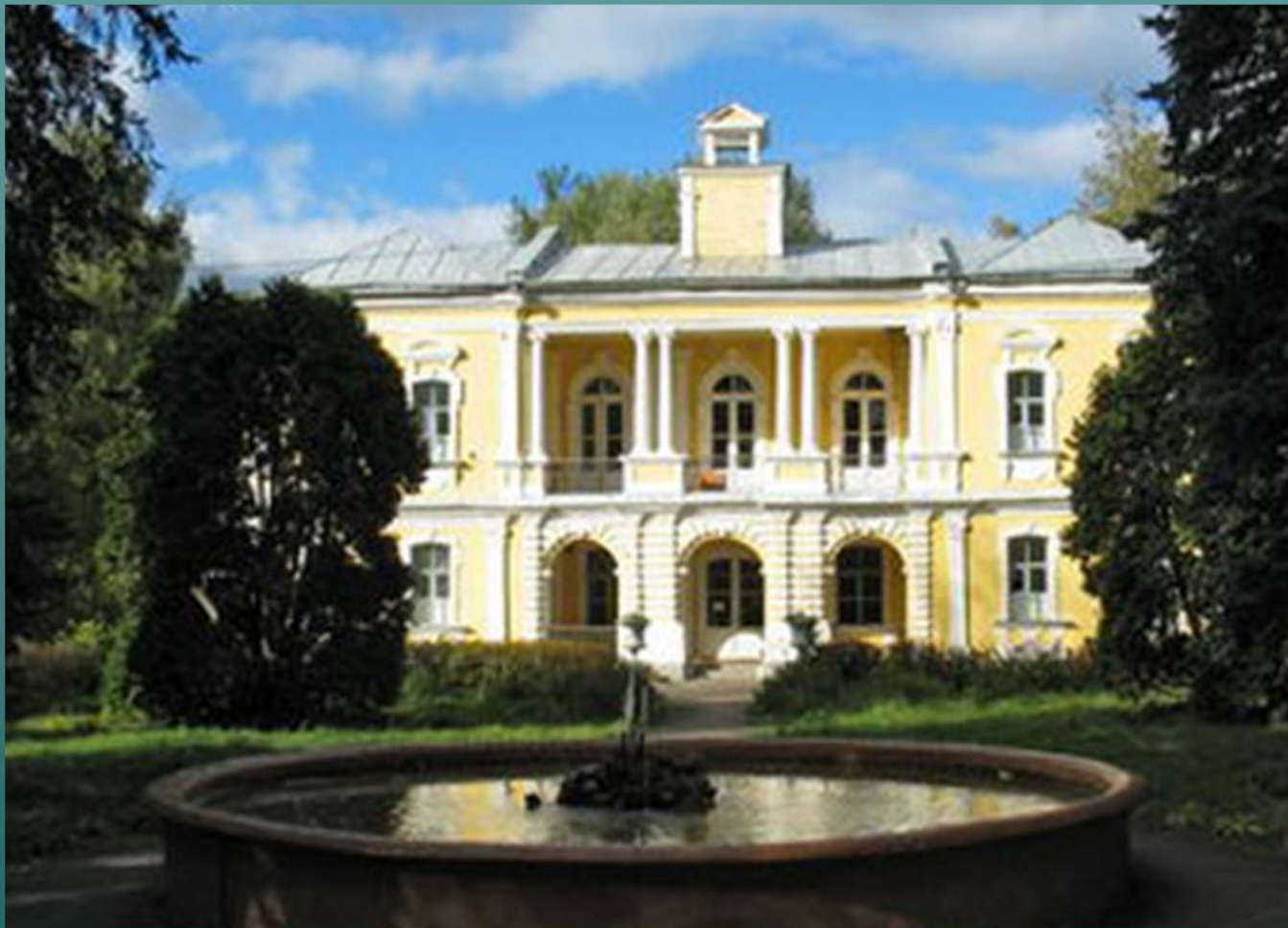
ГЛИНКИ – УСАДЬБА БРЮСА