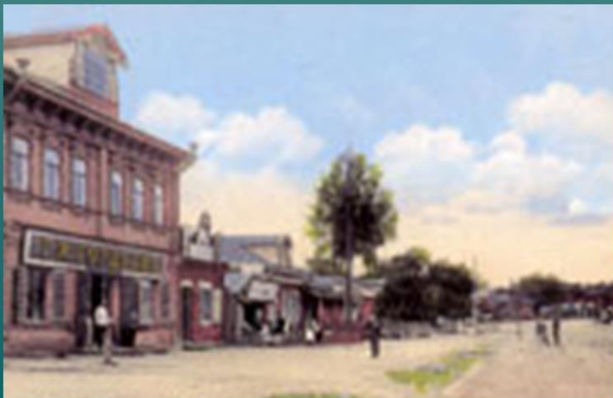
ГЛАВНАЯ УЛИЦА 1912 г.