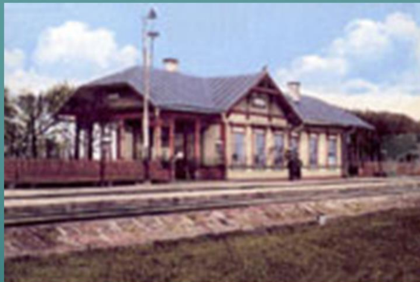
ВОКЗАЛ 1912 г.