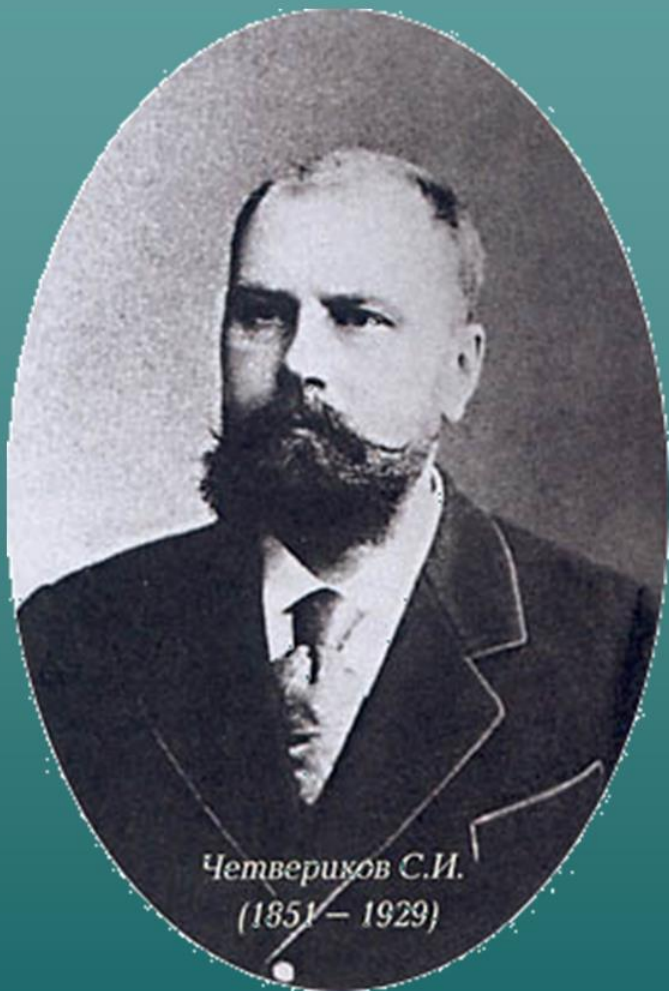
Четвериков С.И. (1851 – 1929)