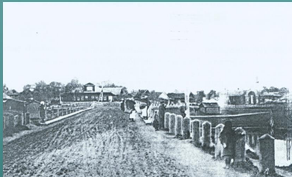
ВИД С МОСТА НА СОБОЛЕВКУ 1915 Г.