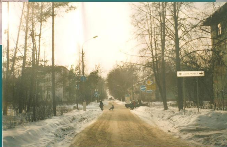
УЛИЦА И.И. ИВАНОВА