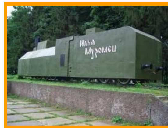
Памятник вербовчанам, павшим в боях за Родину в 1941-1945 гг. установлен в микрорайоне Вербовский.