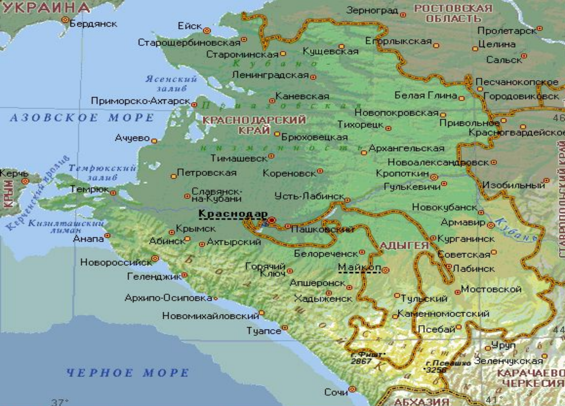
КРАСНОДАРСКИЙ КРАЙ И АДЫГЕЯ