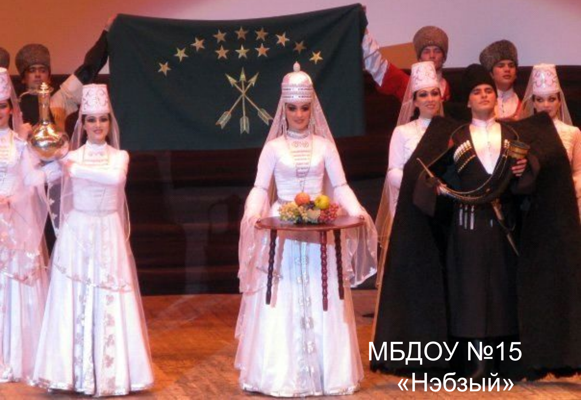
МБДОУ №15 «Нэбзый»