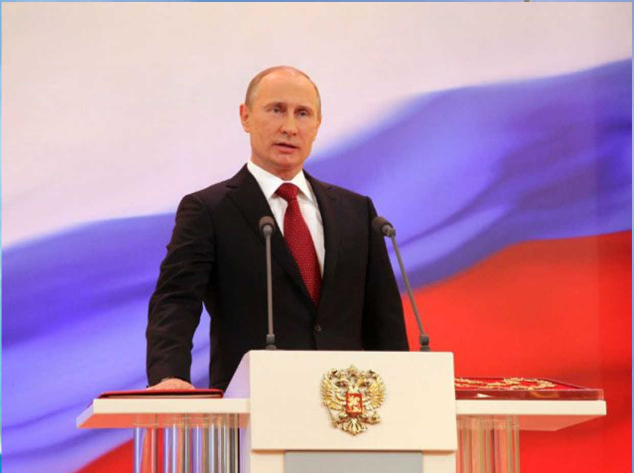
Президент Российской Федерации - Путин Владимир Владимирович