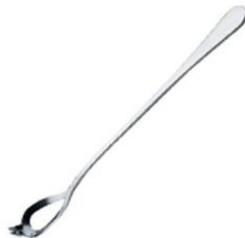
Вилка для оливок