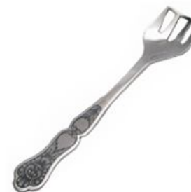
Вилка для шпрот