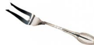
Вилка для лимона