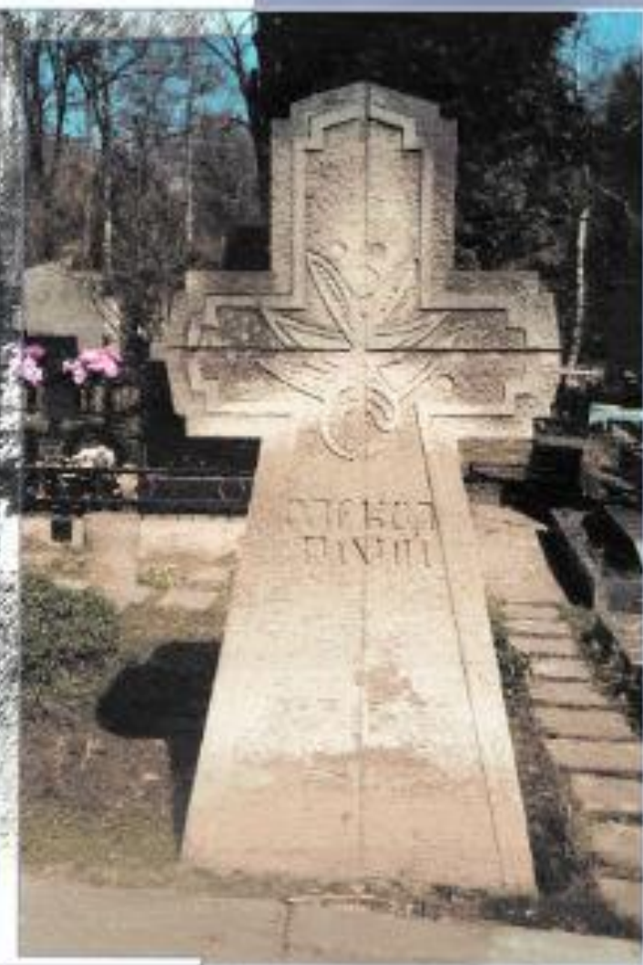
Колонийний хрест на могилі Олекси Тижого на Байковому кладовищі в Києві. Художник Микола Матвійчук, 1993 р.

Олекса Тижий: думки про рідний Донецький край