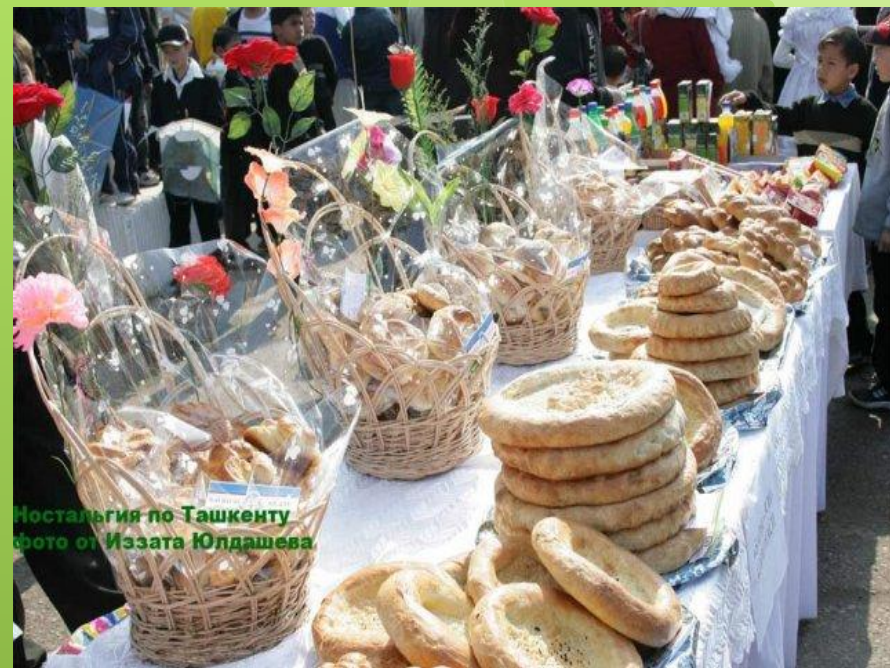
Ностальгия по Ташкенту