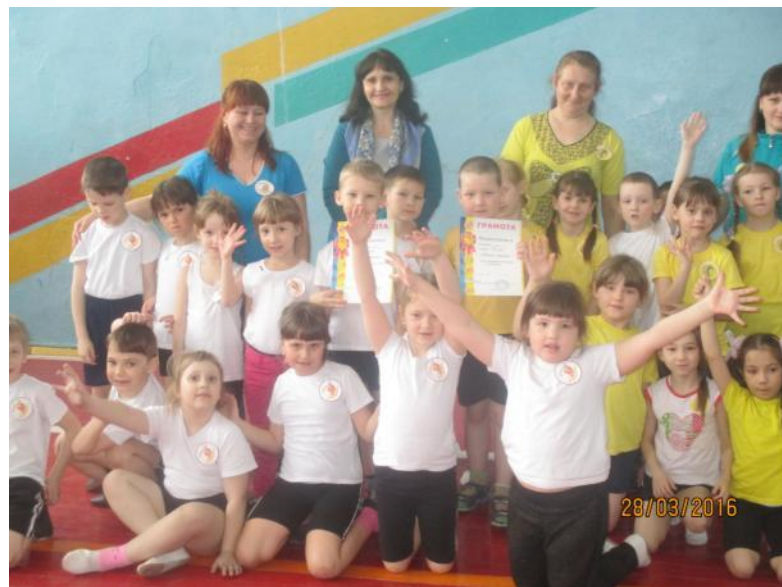
Спортивное мероприятие на базе школы № 8 - 2016 год