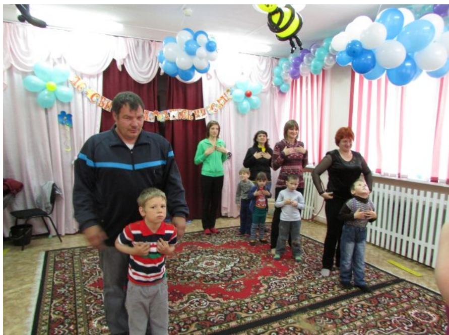
Спортивное мероприятие с родителями и детьми поселка - 2014 год