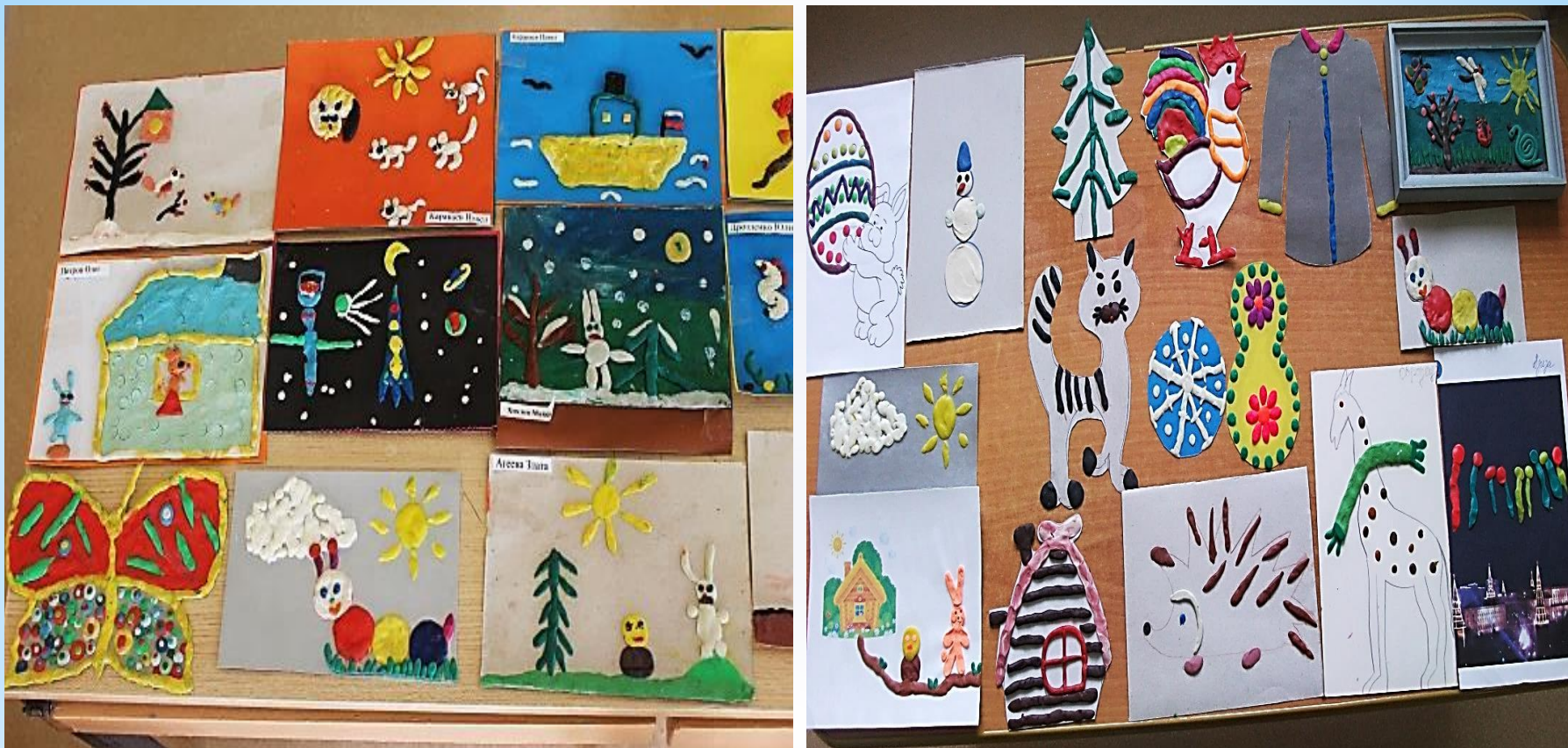
Работы детей кружка «Пластилиновая страна»