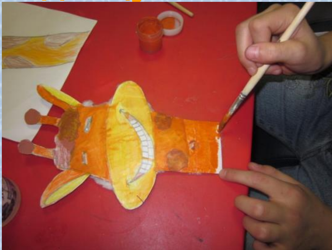
Рисунок Дианы Виноградовой 3 «А» класс