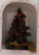
1700 г. Петр I