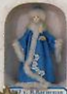
1812 г. Елизавета II