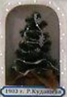
1802 г. Р.Кудрявцев