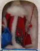
1812 г. Крылов, Елиз