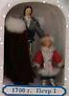
1700 г. Петр I