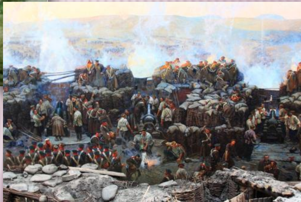
оборона Севастополя в 1854-1855 гг.