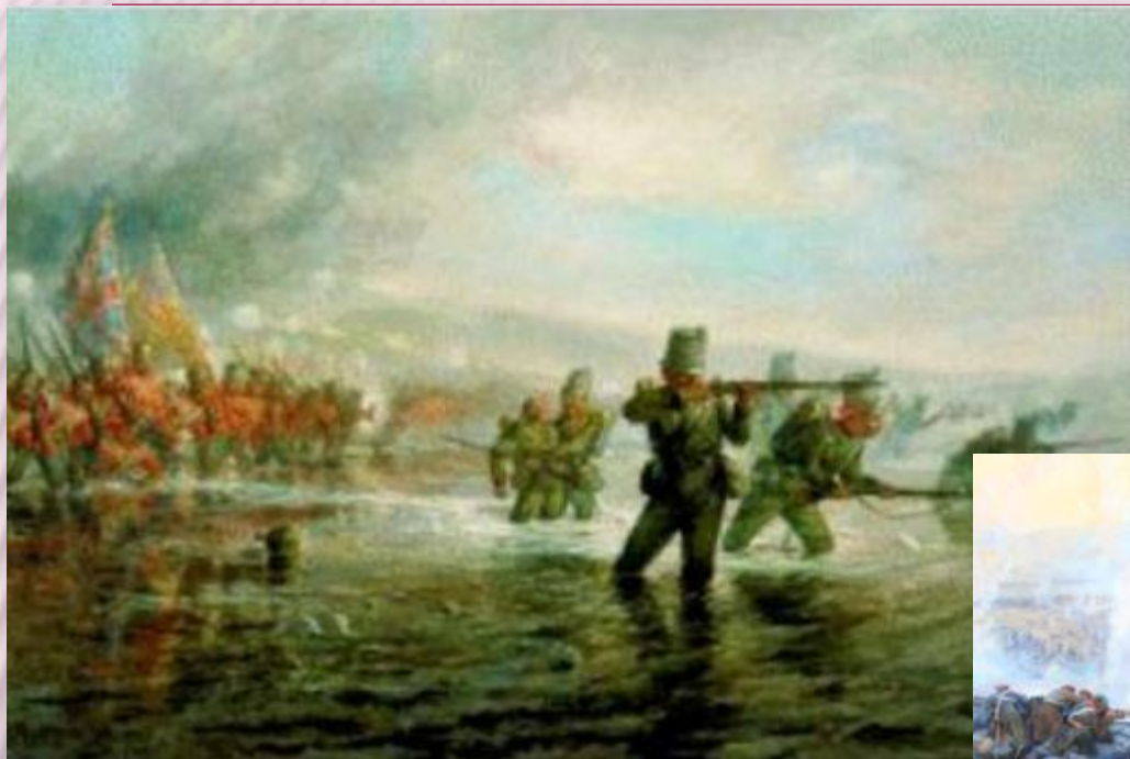
сражение на реке Альме