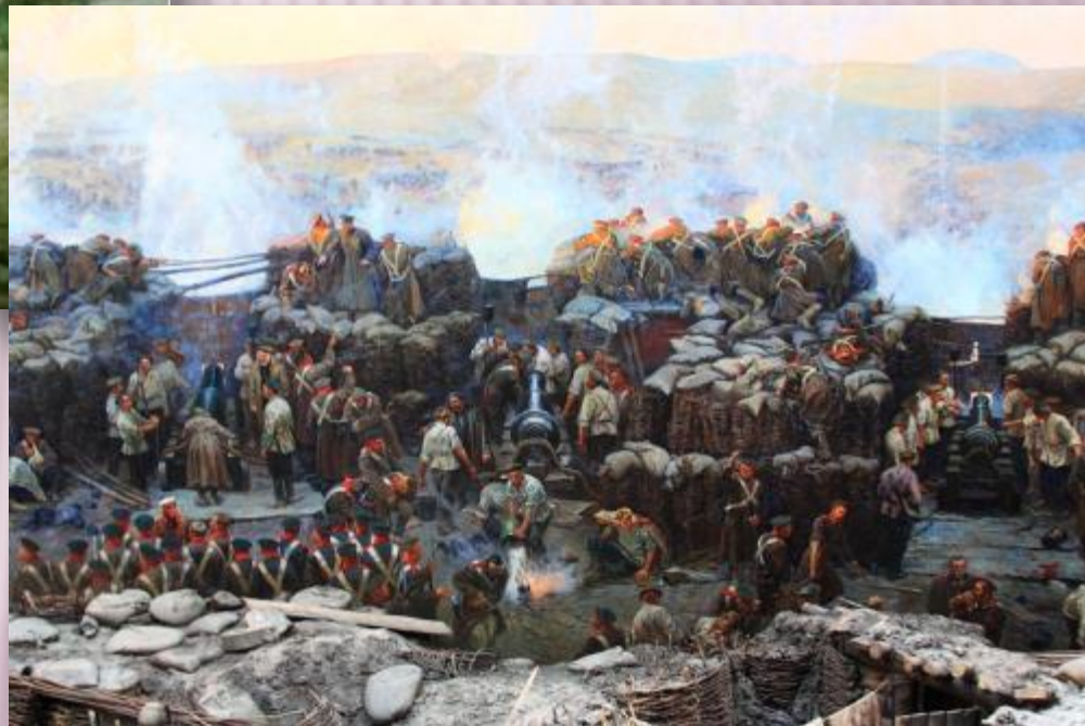
оборона Севастополя в 1854-1855 гг.