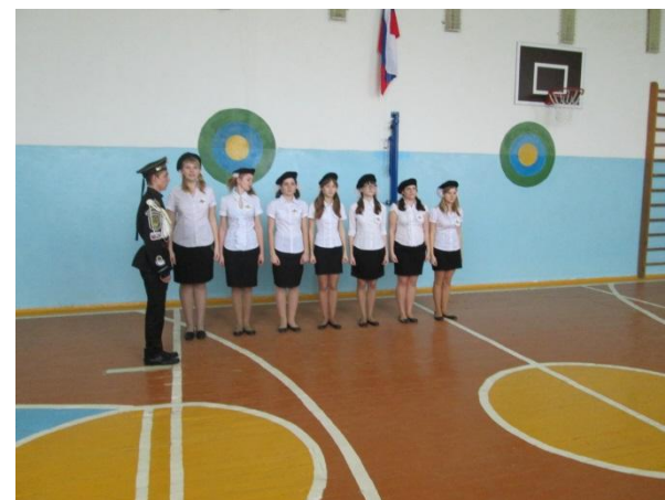
Выступление учащихся 5-11 классов