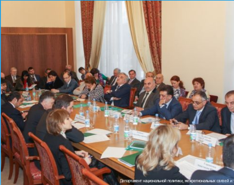
Департамент национальной политики, межрегиональных связей и туризма Департамент национальной политики, межрегиональных связей и туризма

является совещательным органом, содействующим реализации государственной политики на уровне муниципального образования и взаимодействию органов местного самоуправления с учреждениями, организациями, общественными и некоммерческими объединениями в вопросах гармонизации межнациональных отношений