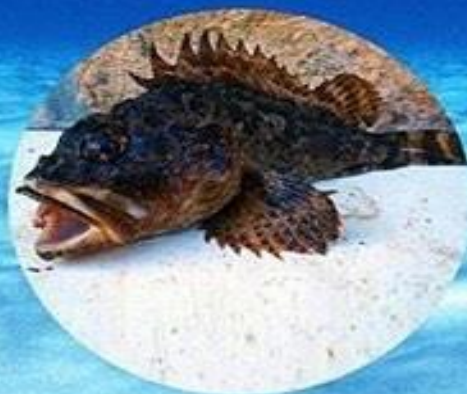
СКОРПЕН, МОРСКОЙ ЕРШ