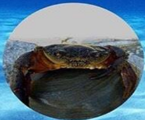
БОЛЬШОЙ КАМЕННЫЙ КРАБ