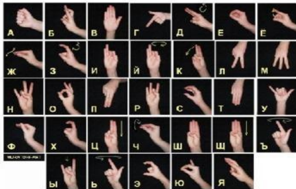
Russian hand alphabet of deaf