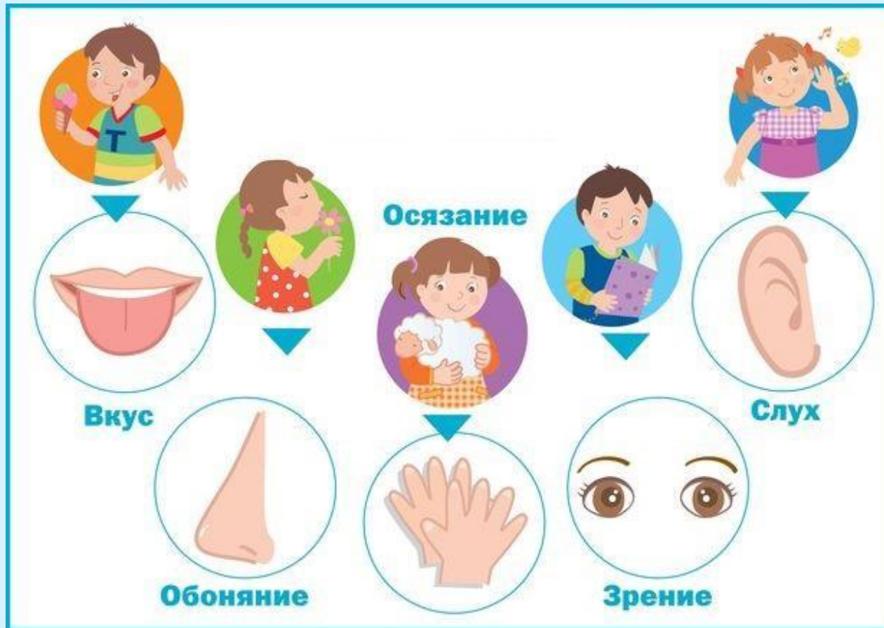
Органы чувств человека