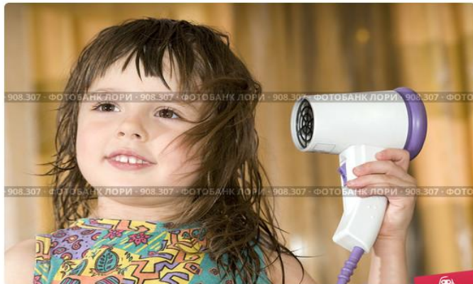
Девочка сушит волосы

Инструкция : придумай предложение по картинке.