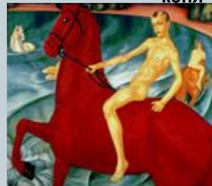
К. Петров-Водкин "Купание красного коня"