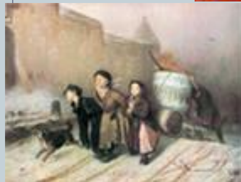
В. Г. Перов "Тройка"