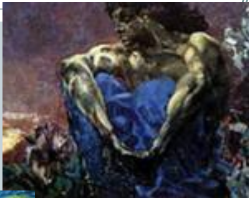
М. Врубель «Демон»